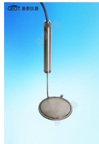
图 4 土中土压力计（垂直式）

立(竖)式与分离式，当土压力作用于压力盒承压膜（一次膜）上，承压膜即产生微小挠性变形，使油腔内液体受压，因液体不可压缩特性而产生液体压力，通过管路传到压力传感器的